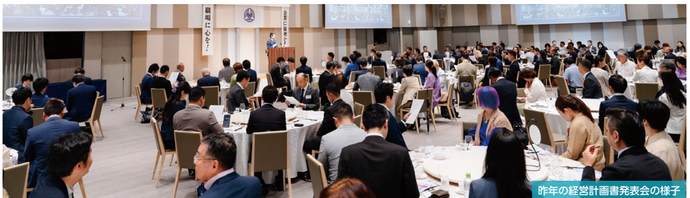
昨年の経営計画書発表会の様子