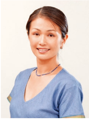
大阪中央区倫理法人会 実行委員