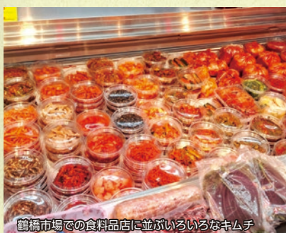
鶴橋市場での食品店に並ぶいろいろなきムチ

660年、半島の百済が唐・新羅によって滅ぼされ、天智朝廷の命で百済難民（下級官僚の家族）が住まわされたのが、