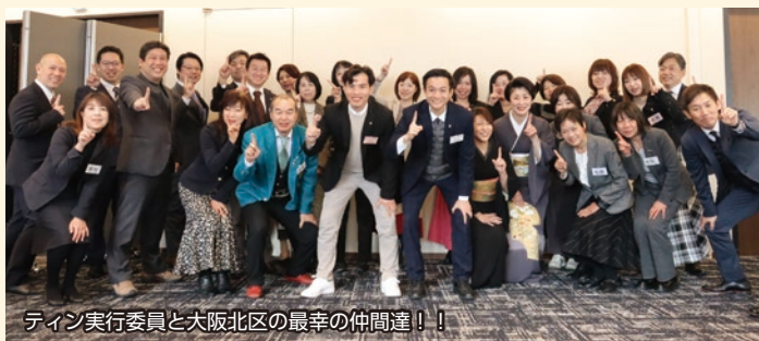
ティン実行委員と大阪北区の最幸の仲間達！！

今期、大阪北区のアファメーションは『世界のトップ単会になっています』と唱っています。