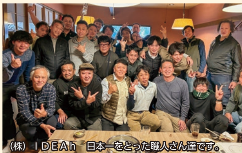
(株)IDEAh 日本一をとった職人さん達です。