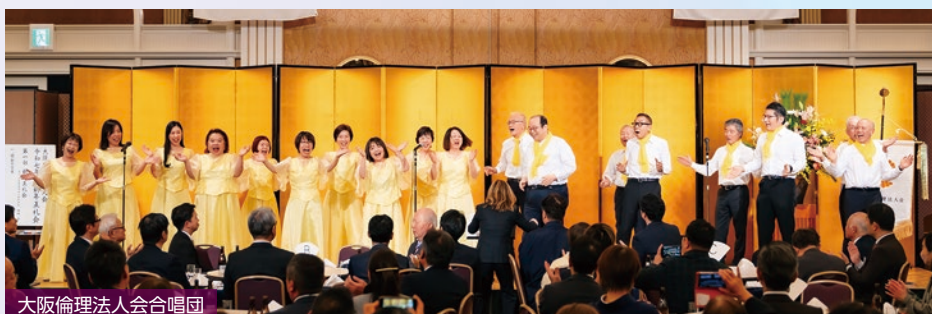
大阪府倫理法人会合唱団