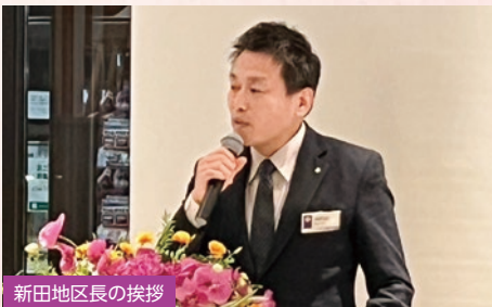
新田地区長の挨拶