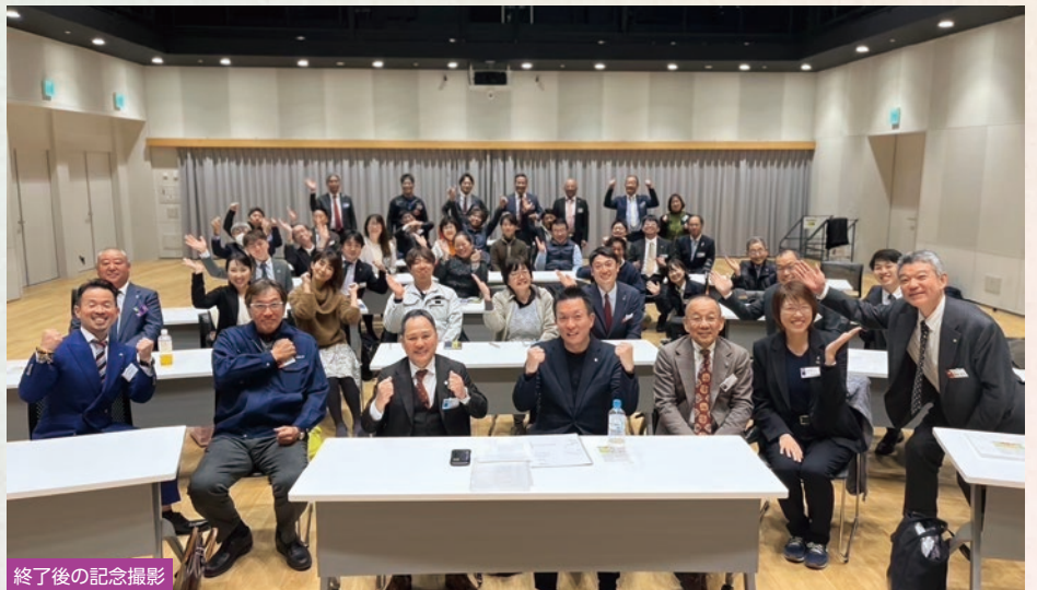
終了後の記念撮影