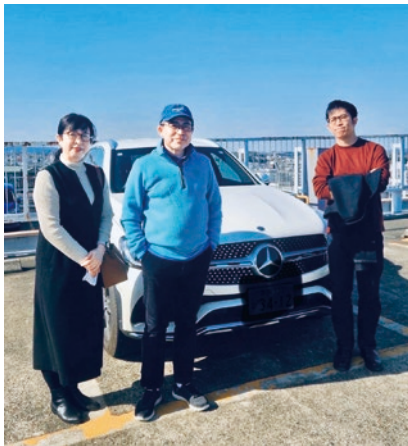
㊦紀子さん、㊦ご本人、㊦息子さん

次に、「挑戦する姿勢」で、元々、勉強熱心な夫が、更に仕事に新しいアイデアを積極的に取り入れるようになりました。その影響を受けた息子が、税理士試験に合格し、今は夫と一緒に働いて、新しい業務に挑戦している姿は、母である私にとって大変、誇らしいです。これからも、夫がどんな風に成長していくのかを楽しみにしています。