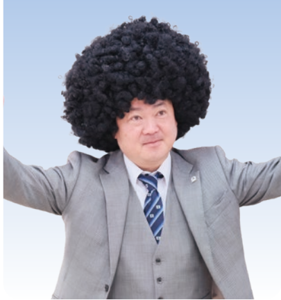
大阪尼崎倫理法人会 会長