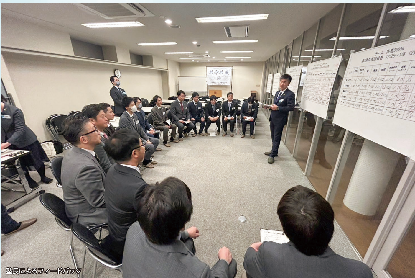
塾長によるフィードバック