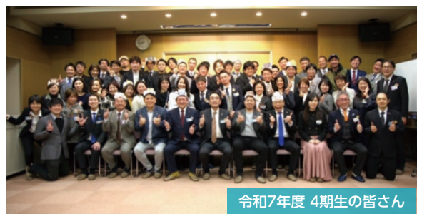
令和7年度 4期生の皆さん

※限定150名にて、第4期生が経営計画書の発表を行います。多くのご参加表明をお待ちしております。