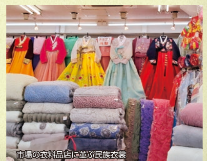
市場の衣料品店に並ぶ民族衣装

鶴橋耕地整理事業、即ち平野川の水利整備が始まるのは大正時代からだ。昭和10年頃、新しい運河、新平野川が姿を現した。此处が焼け野原になった1945年の終戦のとき、闇市が立って、今日の市場のルーツになったと言われている。終戦の年から80年の歳月が流れ、今や彼らも在日何世にもなった。ハンブルが使えない若い人もいるくらいで、その意識は祖先よりも日本人に近くなったのかもしれない。