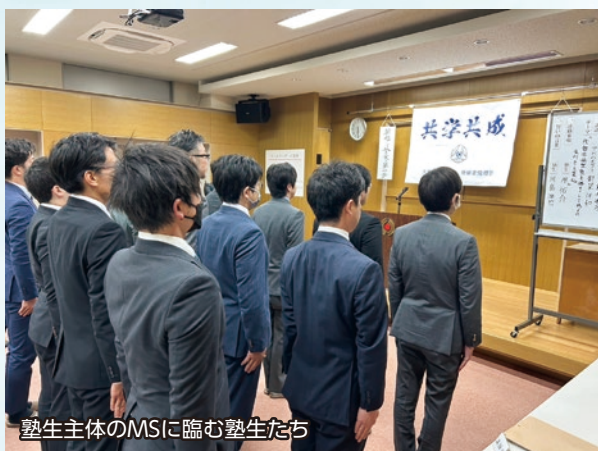
塾生主体のMSに臨む塾生たち

後継者倫理塾には、毎講、塾生の実践報告の機会があります。これは、塾生一人一人が日々の実践に取り組んだ成果を発表する機会です。この機会には、発表する塾生ごとに、ほかの塾生やアドバイザー（修生）からのフィードバックがあります。フィードバックは、馴れ合いではない優しさと責め心のない厳しさをもって行われるべきものとされ、発表内容にとどまらず、前講から当講までの実践の実情も踏まえて、真剣にその塾生のためを思って感じたままを指摘するものです。フィードバックを受ける方としては、フィードバックをする方に対する「責め心」を感じる方も少なくありません。とりわけ塾が始まって間がない時期には、反発が生じやすい場面になります。他方、フィードバックをする方