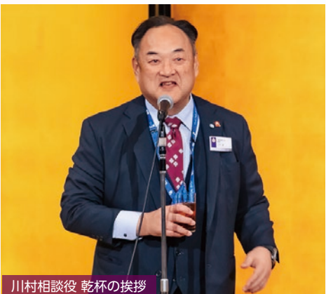
川村相談役 乾杯の挨拶