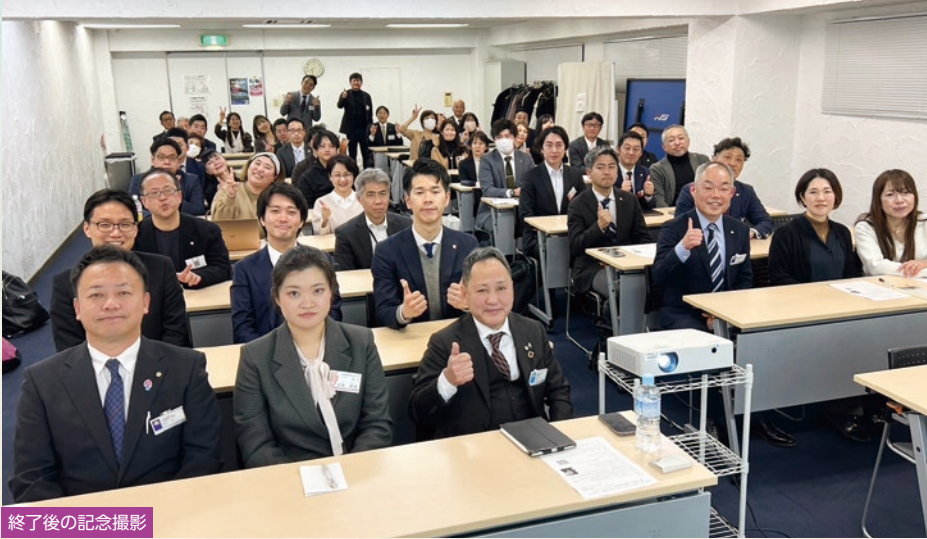
終了後の記念撮影

今期より新人オリエンテーションを地区単位にて、研修委員会主催で行おうと取り組んでおります。各単会ではすでに行っているところもありますが、地区単位で開催することで、単会の垣根を超えた交流が生まれることを狙っています。また、より純粋倫理の理解を深めていただくため、研修委員会独自のカリキュラムを考え、現在ブラッシュアップしております。すでに、大阪東ブロックの3地区と市内南地区は1回目を終了しており、会員さんからは高評価を得ています。