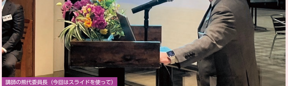
講師の熊代委員長(今回はスライドを使って)