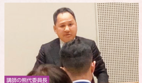
講師の熊代委員長