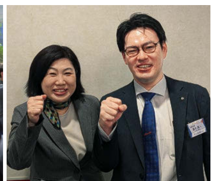
左：大神事務長 右：島木専任幹事