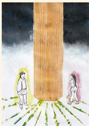
奥谷 梅子 画

ところが、生まれてきたのは水蛭子でございまして。それは葦舟で流しておしまいになりました。そのような「妖しきもの」が生まれたのは、奥様から契りを誘われたからだ、と気づかれるのです。語り手としては、女から男を誘うのがいけない、というより、この作業の責任者（中心者）が伊邪那岐であったのに、そうではない奥様