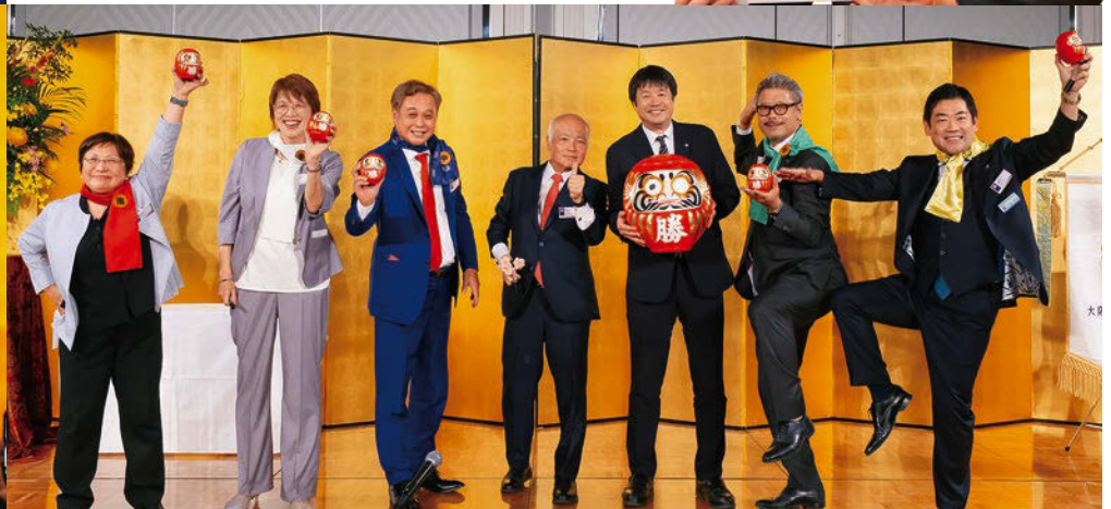
グルマの目入れ式と普及宣隊ゴリンジャー