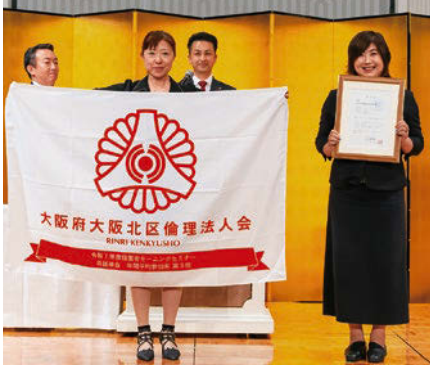
大阪北区 特別行動旗獲得