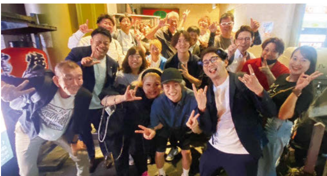
新入会員を囲む会

新大阪倫理法人会では、毎月「新人会員を囲む会」を開催しております。新しい仲間が「日も早く溶け込み、学びを深められるよう、明るく温かな雰囲気づくりを大切にしています。」