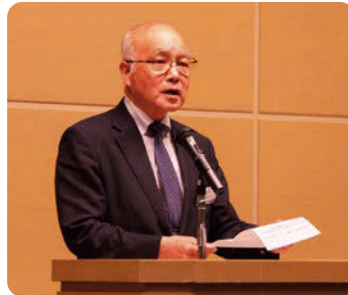
一貫坂会長による挨拶