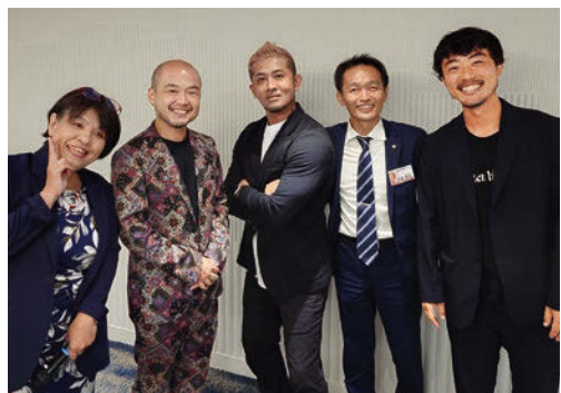
単会向上委員会メンバー