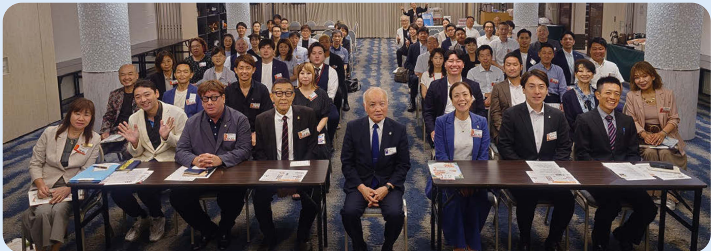
第796回経営者モーニングセミナー

道頓堀倫理法人会は、「希望を持ち実践する仲間がどんどん集まる団体」です。倫理の学びを日々の経営や生活に活かすことで、自らの成長を実感し、周囲へも良い影響を広げます。仲間と共に学