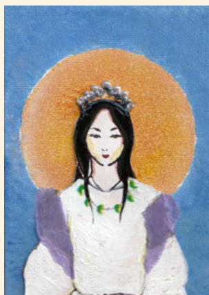
奥谷 梅子 画

来られ、伊邪那美神に「一緒に現世に還ろう」とおっしゃると、伊邪那美神は「残念ながら、手遅れです。この国のものを口にしましたので、それは叶いません。ただ、伊邪那岐大神様が此処まで来られたことは恐れ多く、黄泉神と相談してみましよう。暫くお待ち下さい」と真つ暗な部屋で待たせられたのです。いくら待っても伊邪那美神は現れません。そこで櫛の歯を一本抜き、火を付けて辺りを見回されたのです。なんと、目の前に蛆のたかった伊邪那美様が横たわり、身体の隅々に八柱の雷神が貼り付いておりました。あまりの汚らしさに伊邪那岐神は逃げられました。伊邪那美神は起き上がり、「よくも私に恥をかかせましたね」と黄泉醜女(ゾンビの女たち)に命じ、後を追わせられたのでございます。伊邪那岐神が蔓草の髪飾りを投げ捨てられると、沢山の葡萄の房が実る木になりました。櫛を投げ捨てられると、無数の笥が土から出