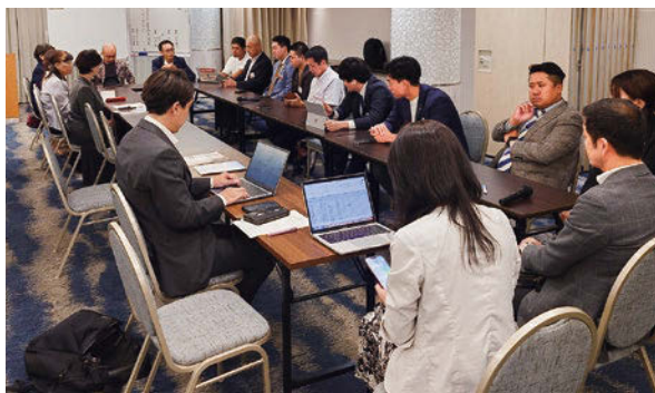
単会向上委員会 会議風景

道頓堀倫理法人会に「向上委員会」が新設されました。単会の発展のためにあらゆる挑戦を行い、会員満足度の向上とコミュニケーションの活性化を推進。MSには常時自単会員100名の参加を目指し、皆が集い、たくなる場づくりに力を注ぎます！