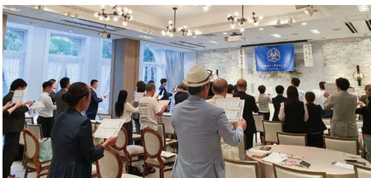
良い氣に満ちているMS会場単会自慢