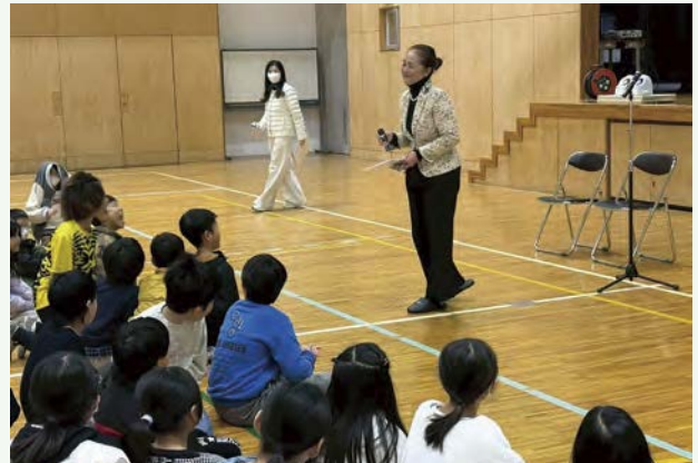
▲ 職業講話に、児童が真剣に耳を傾ける

わたしたち世代による「日本創生」だけでなく、「次世代による日本創生」へと繋いでいくことを目指しています。10年先、20年先（創始者・生誕100年目）を見据えて活動していきます。