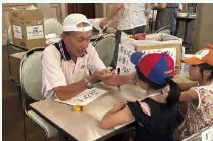
▲ 地域イベントで子どもたちと笑顔の交流