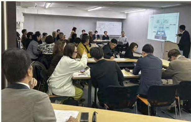
▲ 今回ゲストを含め30名以上が集い取り組みを共有する委員会

なぜ文教委員会が必要なのか。一つに、1980年統計開始以来過去最多となる「青少年の自殺率」です。全国75,000社を超える「心の経営ネットワーク」、倫理経営者にしか伝えられない「純粹倫理」を子どもたちにデリバリーする。「今」これを活かす時がきました。