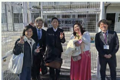
▲ 出前授業の記念に、校長先生と門前で一枚