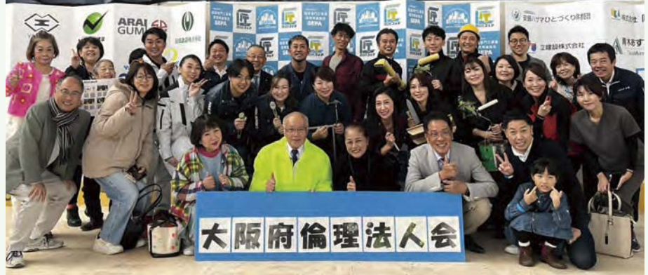
▲ 様々な世代の方に展示や技能体験を経験してもらい業界への理解を深めるイベント

「大人って楽しそう」「こんな大人になりたい」と思える「喜働する大人の姿」を見せ、夢や希望を持つ子どもを増やす活動をする。現在200社登録の「文教企業」「賛同団体」「文教サポーター」を、大阪府5000社達成を見据え1000社の登録を目指す。