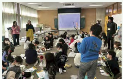
▲ 花を手に体験で学びを深める子どもたち