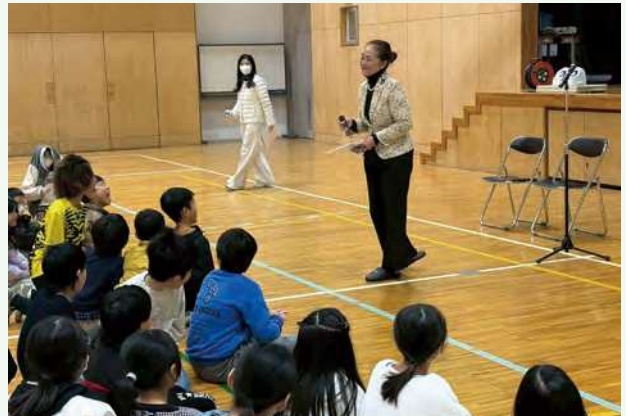
▲ 職業講話に、児童が真剣に耳を傾ける

わたしたち世代による「日本創生」だけでなく、「次世代による日本創生」へと繋いでいくことを目指しています。10年先、20年先（創始者・生誕100年目）を見据えて活動していきます。