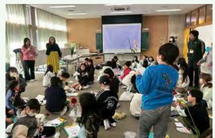
▲ 花を手に体験で学びを深める子どもたち