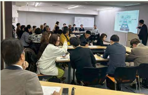
▲ 今回ゲストを含め30名以上が集い取り組みを共有する委員会

なぜ文教委員会が必要なのか。一つに、1980年統計開始以来過去最多となる「青少年の自殺率」です。全国75,000社を超える「心の経営ネットワーク」、倫理経営者にしか伝えられない「純粹倫理」を子どもたちにデリバリーする。「今」これを活かす時がきました。