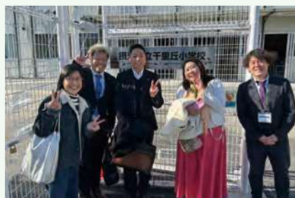
▲ 出前授業の記念に、校長先生と門前で一枚