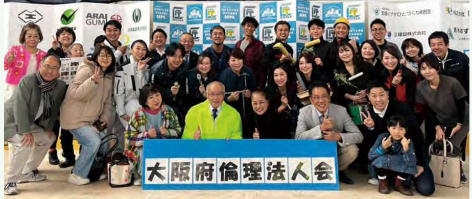
▲ 様々な世代の方に展示や技能体験を経験してもらい業界への理解を深めるイベント

「大人って楽しそう」「こんな大人になりたい」と思える「喜働する大人の姿」を見せ、夢や希望を持つ子どもを増やす活動をする。現在200社登録の「文教企業」「賛同団体」「文教サポーター」を、大阪府5000社達成を見据え1000社の登録を目指す。