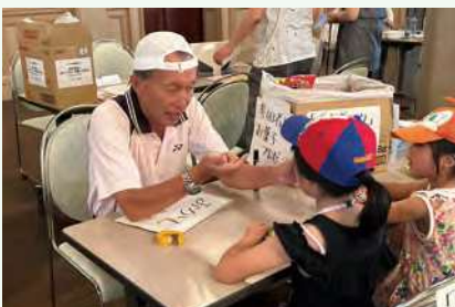
▲ 地域イベントで子どもたちと笑顔の交流