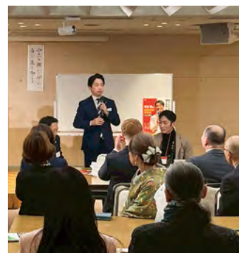
モーニングセミナー