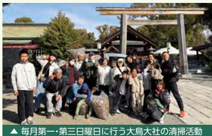
▲ 毎月第一・第三日曜日に行う大鳥大社の清掃活動