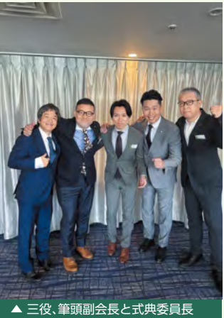
▲三役、筆頭副会長と式典委員長

てくださる方、声をかけてくださる方、当日足を運んでくださる方。その一人ひとりの存在が、この単会の土台になります。