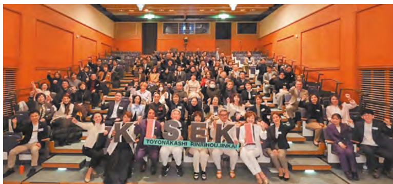
初の試みイベント KISEKI

3月14日に豊中市倫理法人会初の試み、『ギセキ〜大逆転の奇跡と軌跡』を開催しました。当日は100名を超える方に「来場いただき、豊中市の誇るエンターティナー集団が総力を結結したステージは会場を感動の渦に巻き込みました!役員全員が一丸となって作り上げた、まさに『ギセキ』を感じるイベントとなりました。