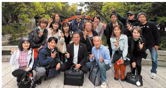
商売繁盛を祈願ツアー